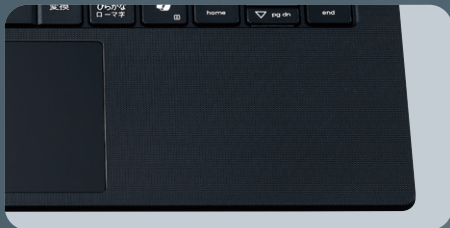
汚れにくいシボ加工のパームレスト