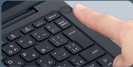
内蔵指紋センサー標準搭載